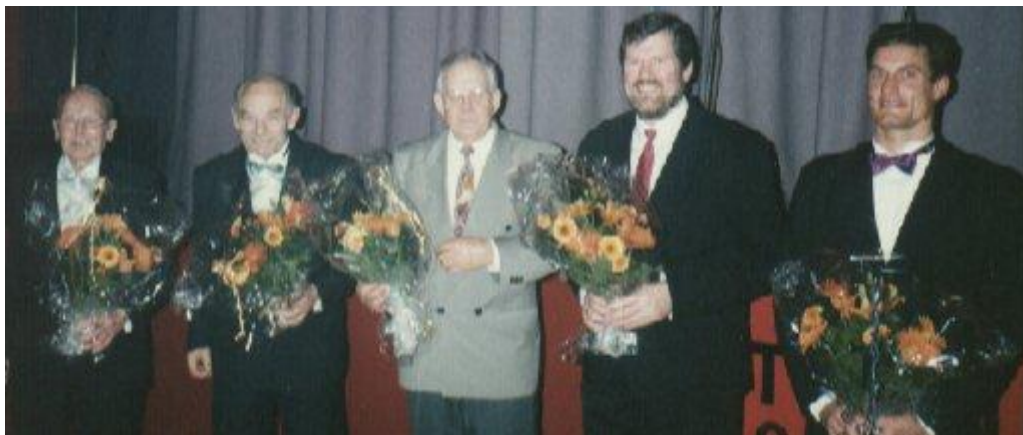
(HBTK 60 års jubilæum 1994)