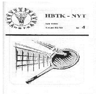
Første nummer af HBTK-Nyt og jubilæumsnummer 1984.

Da Dansborghallen stod færdig i 1966 fik HBTK træningstimer i boldhallen og fra dette tidspunkt skete en eksplosiv udvikling i klubben. Medlemstallet blev 3-doblet, og man så nye perspektiver for HBTK .